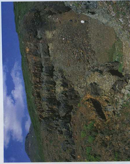
Aðalnámugryfjan frá 19. öld.

Í Hlíðarbrúnum spölkorn ofan Þjóðveggar milli Helgustaðaár og Hrafnar er silfurbergsnáman á Helgustöðum, þekkt undir nafninu Helgustadanáma. Var hún friðlýst sem náttúruvætti árið 1975 að frumkvæði Náttúruverndarsamtaka Austurlands. Rétt utan við námuna rennur lækjarsytra kölluð Silfurlækur og vöktu silfurbergsmolar í farvegi hans fyrst athygli manna á hvað hér væri að finna. Vatn úr læknum kvíslast stundum inn á námusvæðið. Gamall vegruðningur, nú göngustígur, liggur frá Þjóðvegi út og upp að námunni sem er aðeins svipur hjá sjón hjá því sem var meðan þar var numið silfurberg.