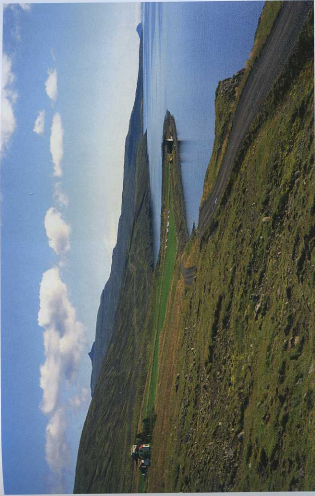
Helgustadir og Helgustaðahlíð. Skerúður utan við fjarðarmynni.